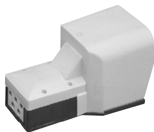
Řada PED502 s ochranným krytem